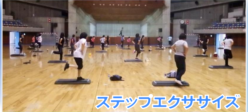
ステップエクササイズ