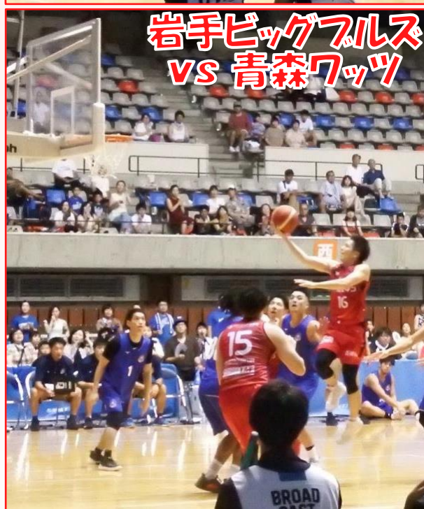
岩手ビッグブルズ VS 青森ワッツ