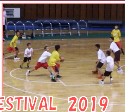
BIGBULLS FESTIVAL 2019