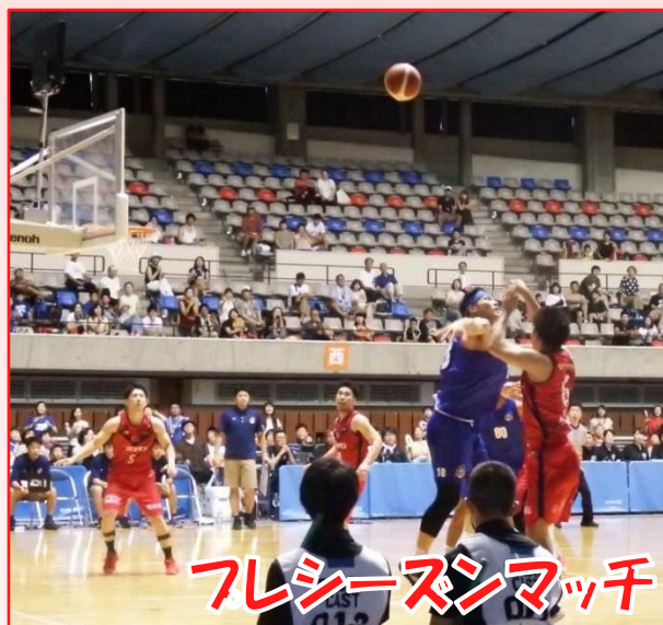
フレッシュンマッチ

第3Qでは、少しでも点差を縮めたいところでしたが57-62とあまり縮まらず最終クォーターへ。第4Qでは、岩手ビッグブルズの追い上げがあり点差が近づくも、残り時間あとわずかのところで惜しくも青森ワッツにシュートを決められてしまい、81-85でプレシーズンマッチは残念ながら黒星となりました。