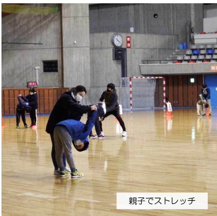
親子でストレッチ

ご参加いただいた皆様には、新型コロナウイルス感染拡大防止対策にご理解とご協力をいただきまして、誠にありがとうございました！