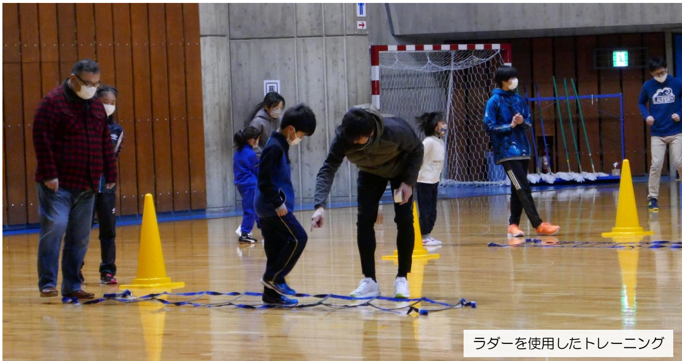
ラダーを使用したトレーニング