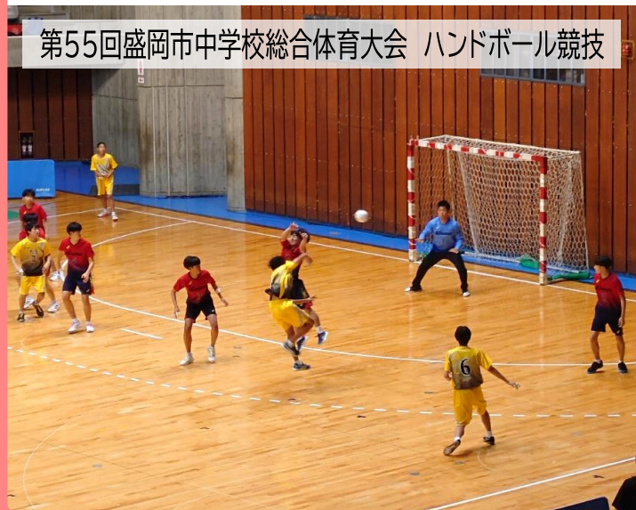
第55回盛岡市中学校総合体育大会 ハンドボール競技

4月から6月は市民体や中総体などが行われ、体操・新体操・トランポリン・バドミントン・ハンドボール・バスケットボール・卓球などの種目、全12大会が開催されたほか、学校行事として、スポーツ大会や球技大会等も行われ、学生からお年寄りまで、老若男女問わず多くの方々にご利用いただきました。