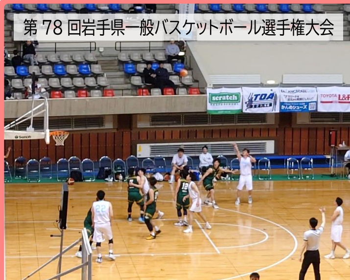
第78回岩手県一般バスケットボール選手権大会