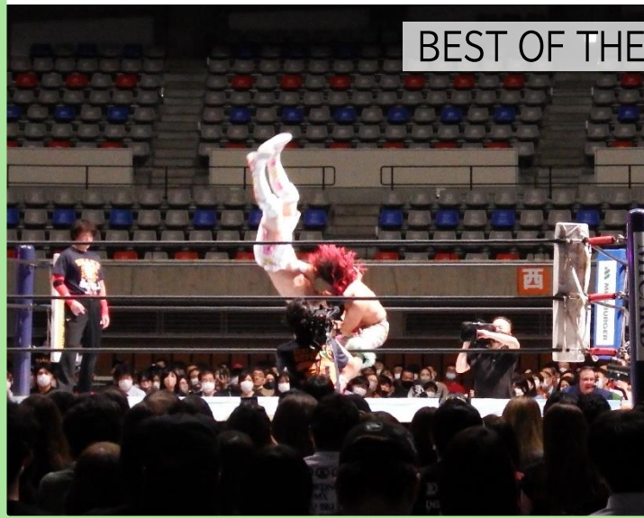
BEST OF THE SUPER Jr.30

当日行われた試合には、前回優勝した高橋ヒロム選手や準優勝のエル・デスペラード選手、今回優勝したマスター・ワト選手が参戦。たくさんの方々が来場され、会場は大いに盛り上がりました。