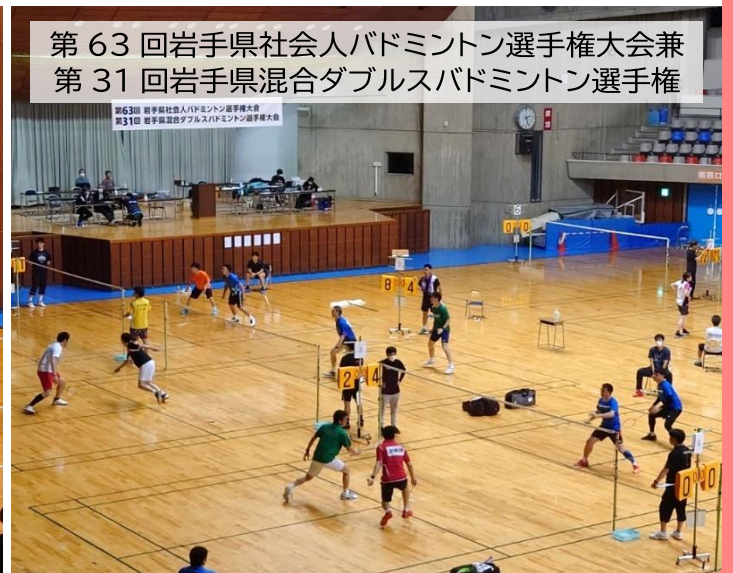
第63回岩手県社会人バドミントン選手権大会兼 第31回岩手県混合ダブルスバドミントン選手権