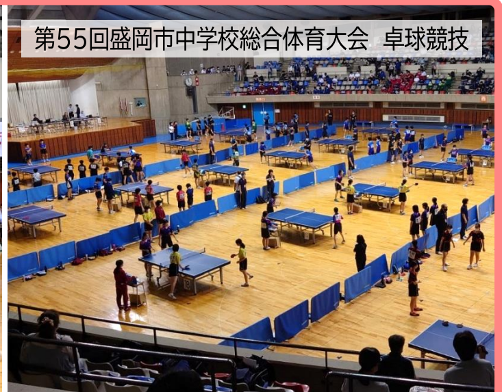
第55回盛岡市中学校総合体育大会 卓球競技

4月から6月は市民体や中総体などが行われ、体操・新体操・トランポリン・バドミントン・ハンドボール・バスケットボール・卓球などの種目、全12大会が開催されたほか、学校行事として、スポーツ大会や球技大会等も行われ、学生からお年寄りまで、老若男女問わず多くの方々にご利用いただきました。