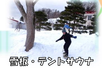
雪板・テントサウナ