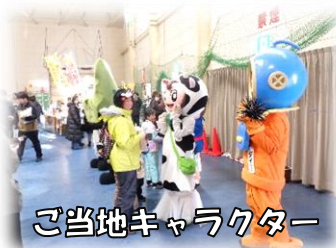
ご当地キャラクター