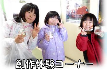
創作体験コーナー