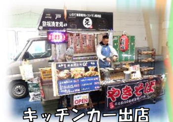
キッチンカー出店