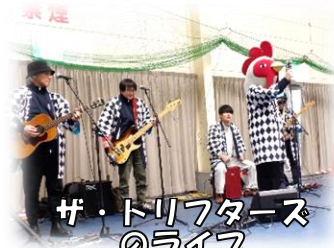
ザ・トリフタース のライブ