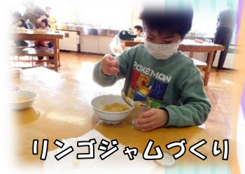
リンゴジャムづくり