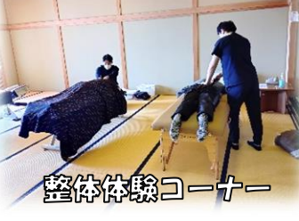
整体体験コーナー