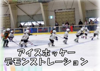
アイスホッケー デモンストレーション