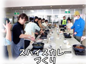
スパイスカレー づくり